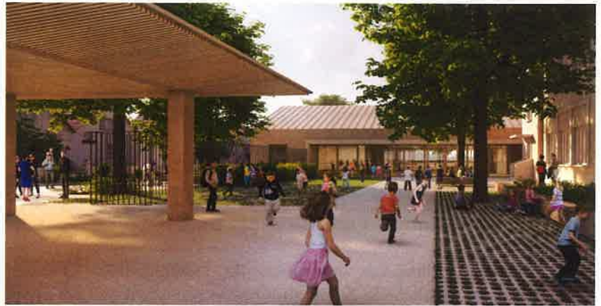
Illustration d'architecte: projet du préau et de la cour d'école

Par ailleurs, un auvent sera annexé à l'actuelle Annexe Guynemer, laquelle verra son mur côté cour déconstruit et l'intérieur du local vidé. Cet aménagement permettra de créer un préau dans la cour pour protéger les enfants de la pluie lors des mauvais jours.