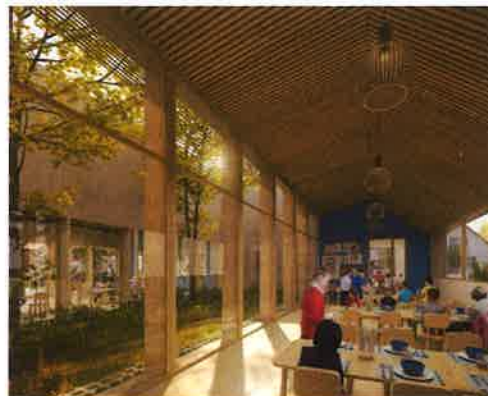
Illustration d'architecte : projet de restaurant scolaire

Le bâtiment ainsi libéré pourra être mis à la vente à un porteur de projet. Un médecin de Longvic a engagé des démarches et pris des contacts pour y installer une maison de santé.